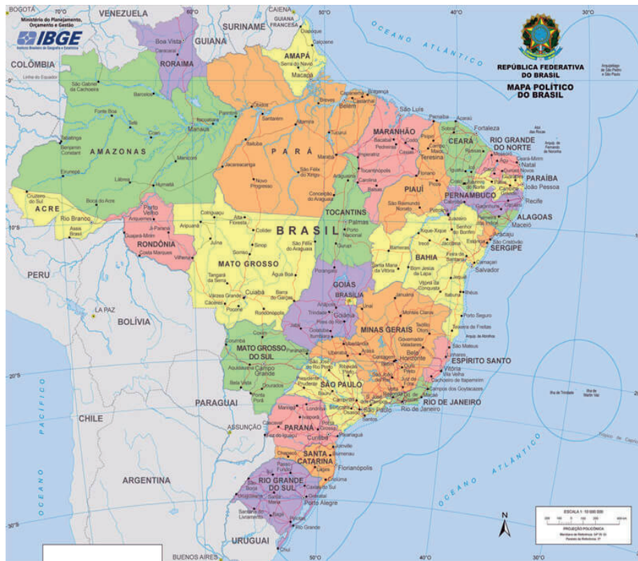
Figura 3 – Ruta del tráfico de personas desde la Región Norte