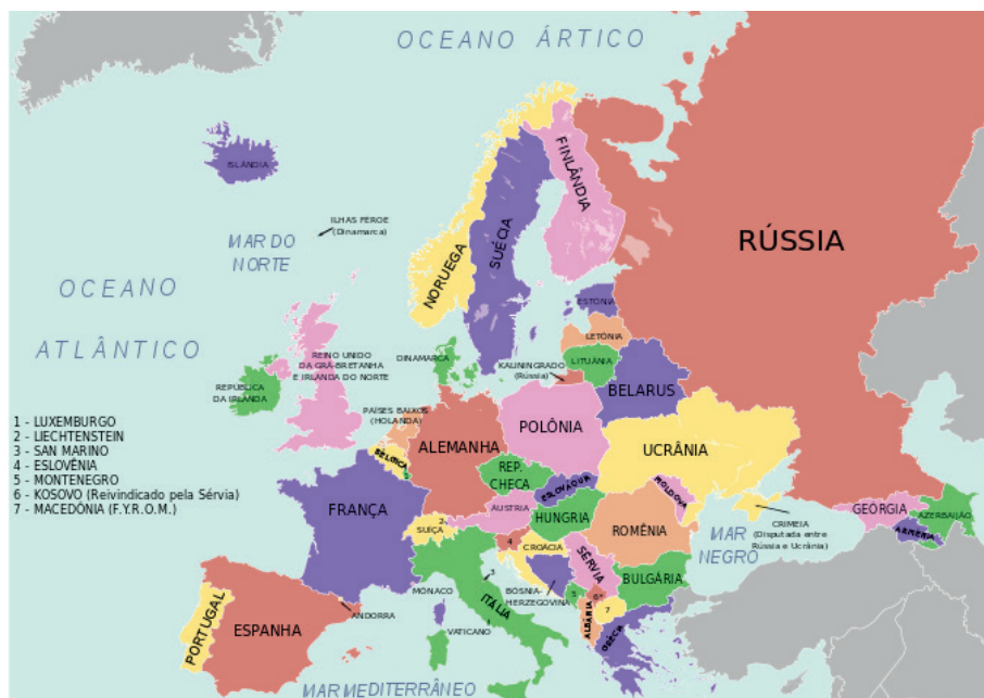
Figura 5 – Ruta del Tráfico Internacional de Personas Región Centro Oeste hacia Europa

Se crean entonces, rutas alternativas, de cómo enviar a las víctimas a Milán, Italia y, posteriormente, tras su entrada en el espacio Schengen, por frontera seca no supervisada, hasta llegar a Portugal, como en el Caso Castañuela, en 2005.