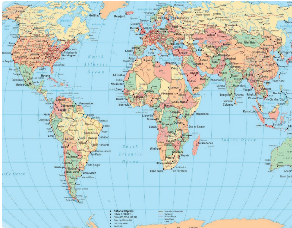
Figura 4 – Ruta São Paulo EE.UU, Europa y Emiratos Árabes