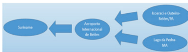
Figura 2 - Proyecto migratorio entre Pará y Maranhão hacia Surinam