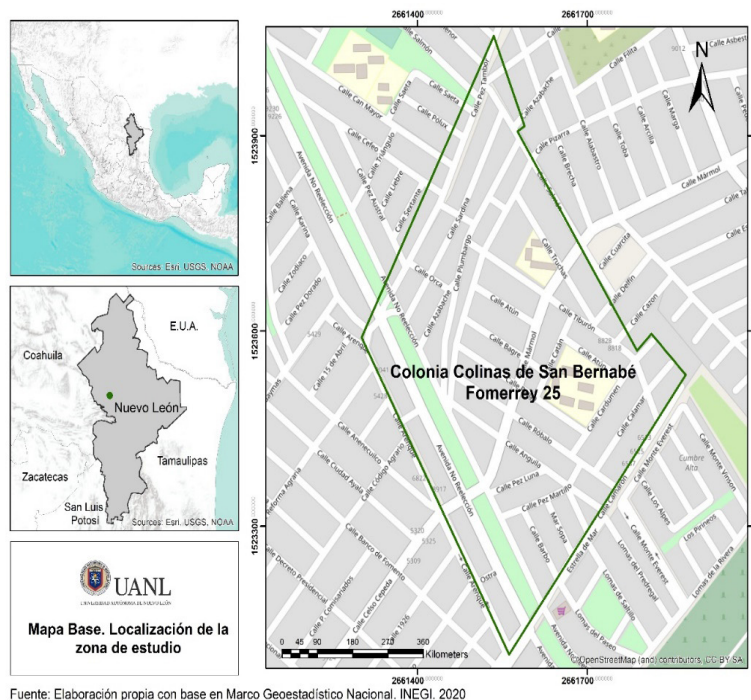
Figura 1 Mapa base de localización de la zona de estudio

Nota. Elaboración Propia, (2020), con base en el Marco geostadístico Nacional. INEGI, 2020